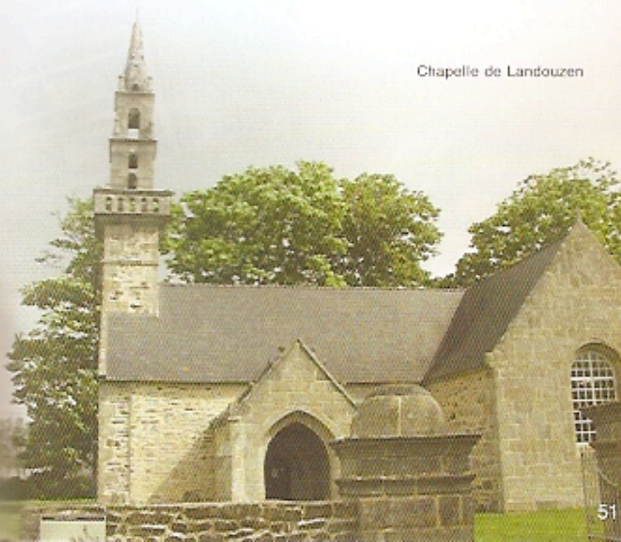
Chapelle de Landouzen

Loc Brévalaire en 1185 prieuré de l'Abbaye de Saint Mathieu puis trêve de la paroisse de Plouvien. Clocher daté de 1639. A l'intérieur de l'église belle collection de statues, présentées dans le porche. Calvaire du XVI e siècle. Contre le mur de la mairie plan de la commune réalisé par les Amis du vieux Lopré.